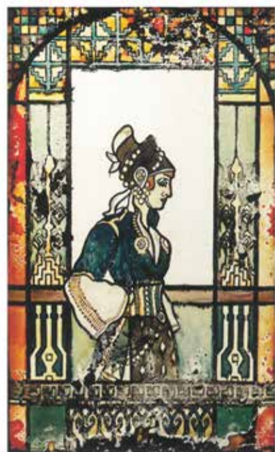
Μουσείο Λαϊκής Τέχνης & Παράδοσης «Αγγελική Χατζημιχάλη»