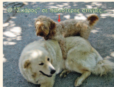
Ο «Σκάρος» σε παλιότερες στιγμές...