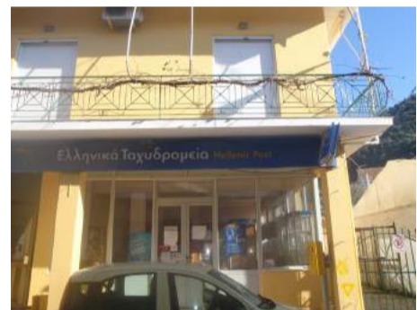
Το Ταχυδρομείο στη Βασιλική