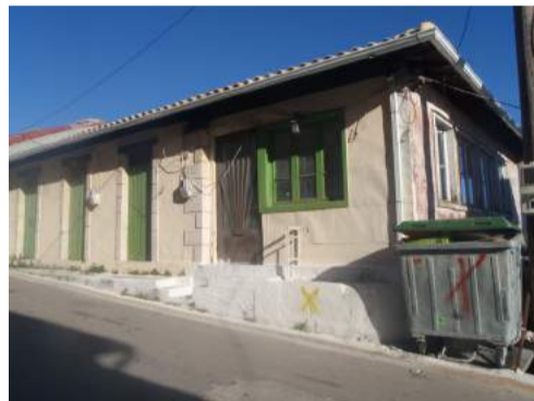
Οίκημα του Δήμου στον Άγιο Πέτρο

Οι πρώτες ενέργειες των Τοπικών Αρχών ήταν η προσφορά φαγητού, νερού, σκηνών και νάυλον για την προστασία από την βροχή των πληγέντων οικιών. Αμέσως, επίσης, έσπευσαν εκτάκτως γιατροί στο Κέντρο Υγείας της Βασιλικής, το οποίο συνήθως δεν είχε και δεν έχει. Το ΤΑΣ (Οργανισμός Σεισμόπληκτων) Λευκάδος επαναδραστηριοποιήθηκε άμεσα, με μηχανικούς που έσπευσαν από διάφορα μέρη της Ελλάδας. Δημιούργησε επιτροπές πρωτοβάθμιες, δευτεροβάθμιες και τριτοβάθμιες, για την διεξαγωγή του ελέγχου των κτηρίων που επλήγησαν από τον σεισμό. Το ΤΑΣ εξέδωσε και δημόσια ανακοίνωση που ενημέρωνε τον κόσμο για το τι σημαίνει το σημάδι «πράσινο», «κίτρινο», ή «κόκκινο» στα κτήρια.