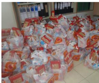
Τρόφιμα. Προσφορά της αλυσίδας Σούπερ Μάρκετ «ΣΚΛΑΒΕΝΙΤΗ» στους σεισμόπληκτους Λευκαδίτες