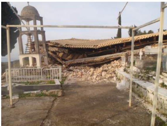
Ιερός Ναός Αγίας Παρασκευής στο Αθάνι. Καταστράφημε ολοσχερώς

Ο Δήμος Λευκάδας έσπευσε να συνδράμει με μέτρα βοήθειας και στήριξης των σεισμοπαθών.