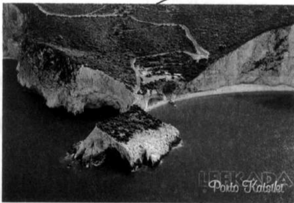
ΠΟΡΤΟ ΚΑΤΣΙΚΙ Η ΑΚΡΟΠΟΛΗ ΤΗΣ ΛΕΥΚΑΔΑΣ

Χάρτης ΧΑΡΑΚΤΗΡΙΣΜΟΥ Έκτασης όπως αναρτήθηκε στα χωριά Βασιλική, Αγ. Πέτρο, Κομηλιό, Δράγανο και Αθάني από τον κ. Νικόλαο Μπρατζουκάκη τον Μάρτιο του 2007