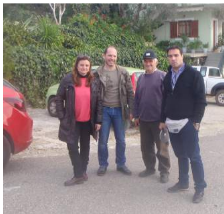
Δευτεροβάθμιος επιτροπή μηχανικών του ΤΑΣ