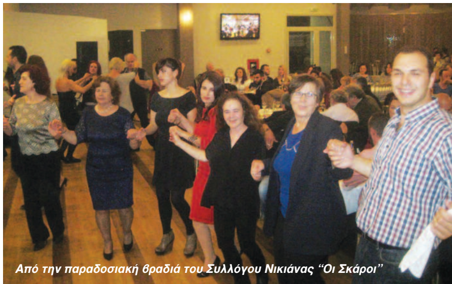
Από την παραδοσιακή βραδιά του Συλλόγου Νικιάνας «Οι Σκάροι»

23, 24 ΑΠΡΙΛΙΟΥ & 02, 03 ΜΑΪΟΥ 2016 ΠΝΕΥΜΑΤΙΚΟ ΚΕΝΤΡΟ ΔΗΜΟΥ ΛΕΥΚΑΔΑΣ ΏΡΑ: 21.00 • ΠΛΗΡΟΦΟΡΙΕΣ: 6977450732