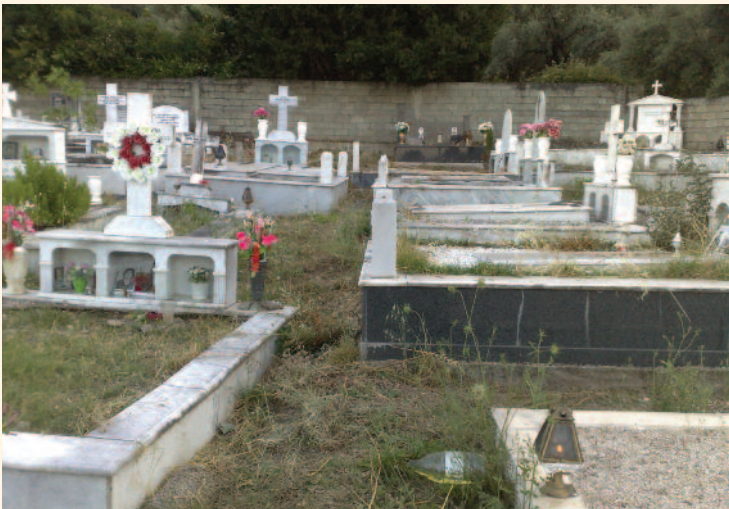
Ας μας εξηγήσει κάποιος προς τα που είναι η ανατολή

✓ Πολλές φορές οι «Αντίλαλοι» ασχολήθηκαν με το θέμα του Νεκροταφείου. Στη Νικιάνα σήμερα η κατάσταση έχει φτάσει στο μη παρέκει αφού σε λίγο δεν θα υπάρχει χώρος ταφής. Η ευθύνη βαρύνει το Δήμο και το Τοπικό Συμβούλιο, που έχουν την αρμοδιότητα για την μη έγκαιρη απόκτηση νέου χώρου, «των φρονιμών τα παιδιά πριν πεινάσουν μαγειρεύουν», αλλά και σε πολλούς από εμάς που η ματαιοδοξία μας μάς οδήγησε σε υπερβολές στις κατασκευές των μνημείων.