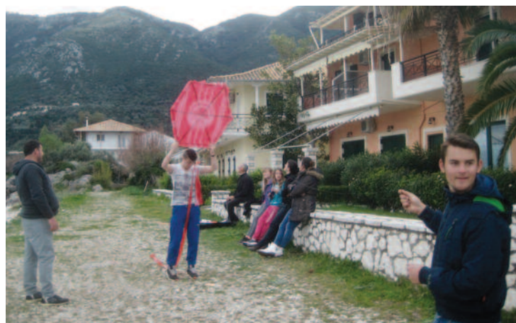
Παρότι δεν έχει φτερά ο Ολυμπιακός πετάει, ενώ ο δικέφαλος αετός έχει χαμηλές πτήσεις και το τριφύλλι ξεράθηκε!!!

Επισημους δεν διακρίναμε, ούτε καν από τον Δήμο Λευκά-