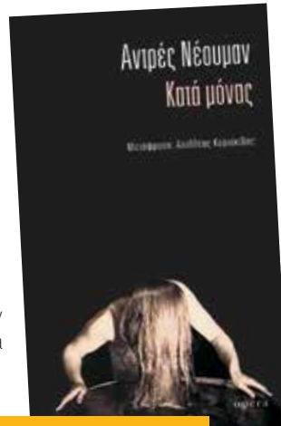
«HABLAR SOLOS» ANDRES NEUMAN

Con el apoyo de AC/E, la editorial Ópera, PUBLIC y Abanico, y el auspicio de las Embajadas de Argentina y España.