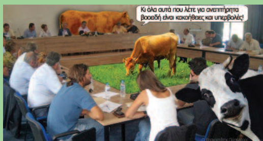
Του ποπολάρου, όπως αναρτήθηκε στο site "Αρωμα Λευκάδας"

Έγινε αναλυτική συζήτηση για την εξεύρεση