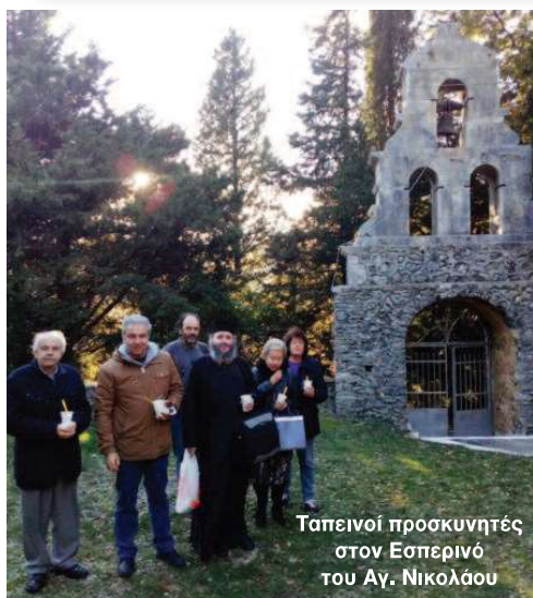
Ταπεινοί προσκυνητές στον Εσπερίνο του Αγ. Νικολάου

Το περίπτερο της «Αγρόθεν» θα είναι το B57-C66.