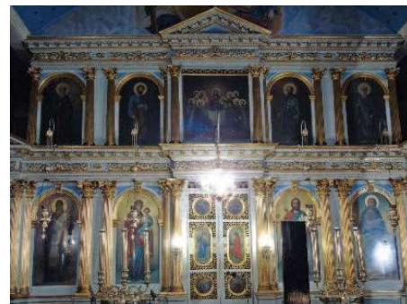
Το τέμπλο του Αγ. Σπυριδώνος στην Καρυά

Έργα του -εκτός Λευκάδας- είναι το τέμπλο