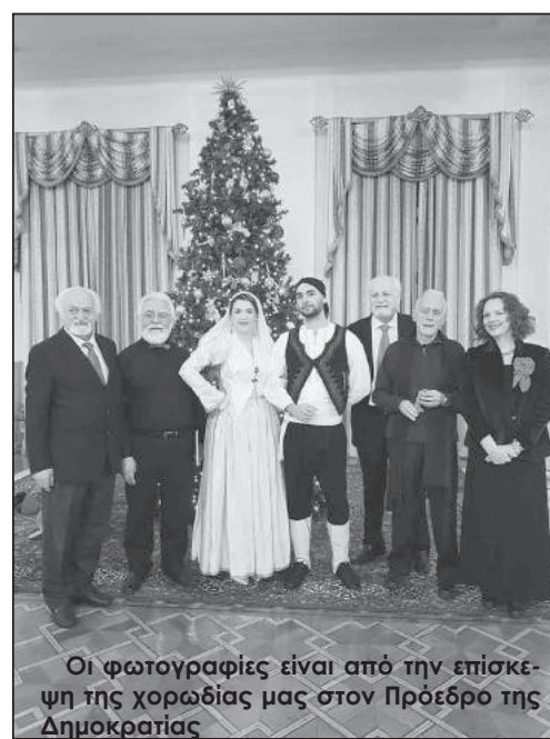
Οι φωτογραφίες είναι από την επίσκεψη της χορωδίας μας στον Πρόεδρο της Δημοκρατίας

και αυτό αντανακλάται στην αποδοχή της στο λευκαδίτικο στοιχείο της Αττικής. Ήδη έχει κληθεί από πολλούς λευκαδίτικους συλλόγους στις εκδηλώσεις τους που γίνονται με αφορμή την κοπή της πίτας τους. Στις 27/1/2019 θα παραβρεθεί στην κοπή της πίτας του Συλλόγου μας ψάλλοντας τα κάλαντα αλλά και τραγουδώντας ποιήματα Λευκαδίτων ποιητών. Καλούμε όσους Λευκαδίτες και Λευκαδίτισσες επιθυμούν