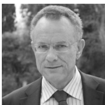
Σολδάτος Θεόδωρος πρώην βουλευτής της Ν.Δ. κατεβαίνει Ανεξάρτητος και υποστηρίζεται από τη ΝΔ.