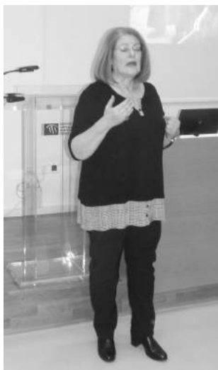
H κα Φιώρου