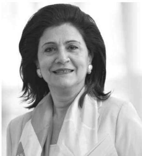
Ρόδη Κράτσα-Τσαγκαροπούλου τέως αντιπρόεδρος του Ευρωπαϊκού Κοινοβουλίου υποψήφια της Ν.Δ.