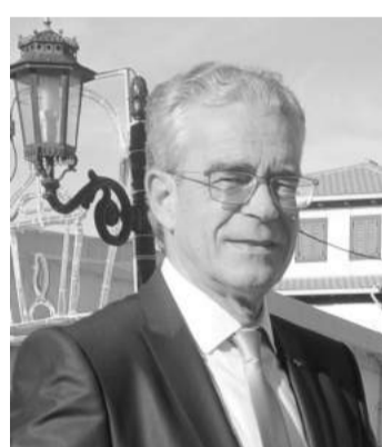
Δρακονταειδής Κων/νος Δήμαρχος Λευκάδας. Υποστηρίζεται από τον ΣΥΡΙΖΑ.