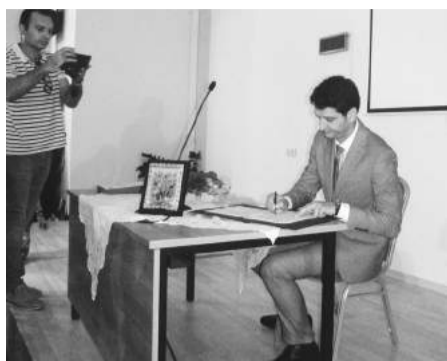
Ο κ. Δήμαρχος υπογράφει το πρακτικό ορκωμοσίας

Την ορκωμοσία από την Ένωση παρακολούθησε ο κ. Αντύπας Απόστολος.