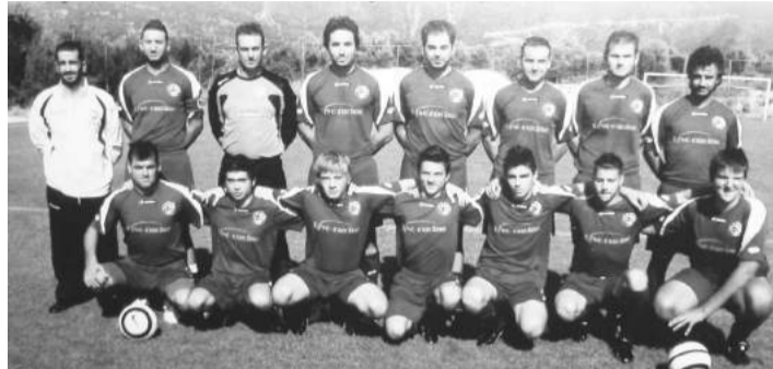
Παλαιά φωτογραφία της ομάδος 2012

Το Δ/Σ του ομίλου ευχαριστεί όλους όσους συνεισέφεραν είτε με προσωπική εργασία με οικονομική χορηγία στην καλοκαιρινή εκδήλωση που διοργάνωσε στο γήπεδο Αγίου Πέτρου στις