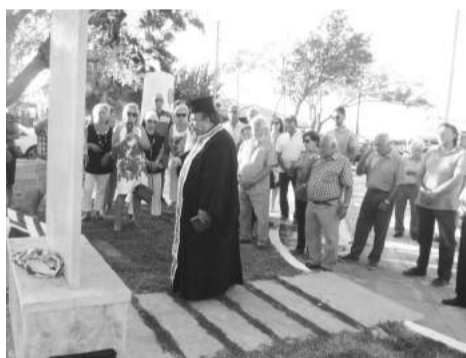
Άποψη από την εκδήλωση