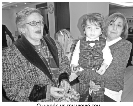
Ο μικρός με την γιαγιά του