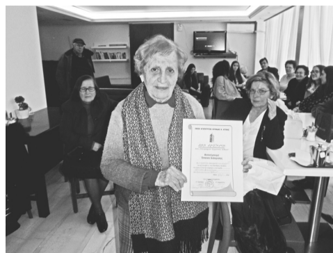
Η γιαγιά Τζεφρώνη για την εγγονή της

Η Ένωσή μας τους ευχαριστεί πολύ για την προσφορά τους