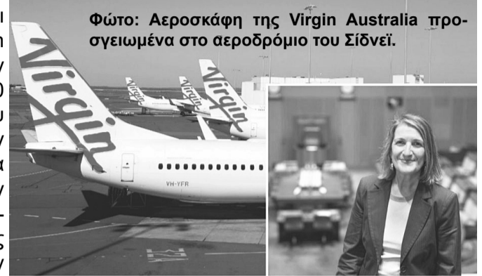
Φώτο: Αεροσκάφη της Virgin Australia προσγειωμένα στο αεροδρόμιο του Σίδνεϊ.

“Οι λόγοι είναι γνωστοί και έχουν να κάνουν με τον ανταγωνισμό και τα φθηνότερα αεροπορικά ναύλα. Το μονοπώλιο δεν είναι ποτέ καλό, και αυτό δεν έχει να κάνει με την