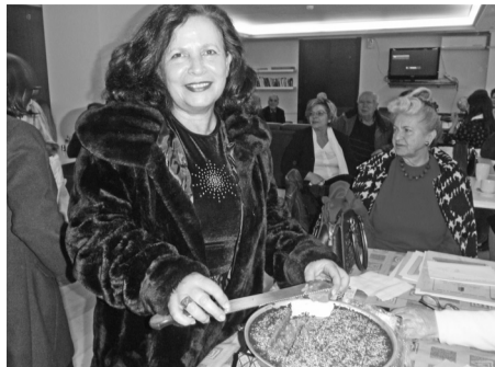
Η κα Καγκελάρη, συνταξιούχος δικαστικός