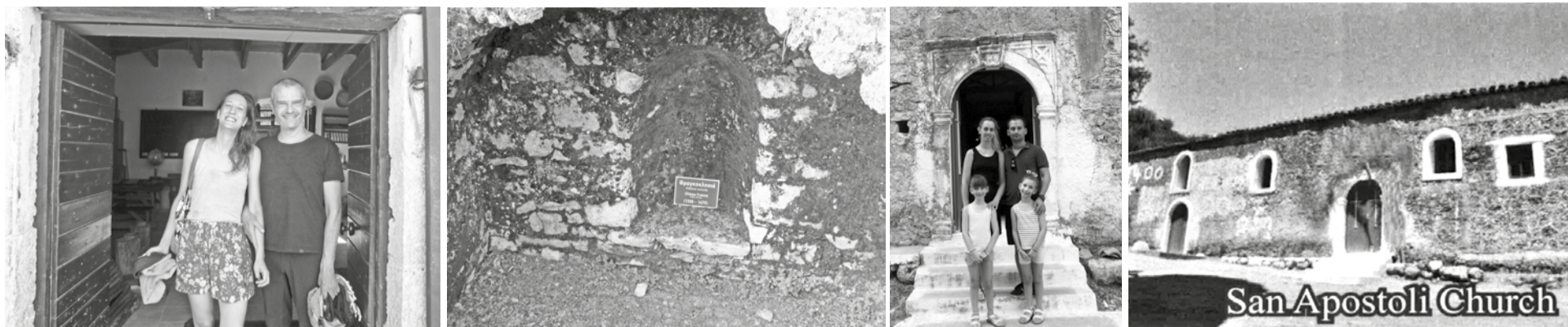
ΜΟΥΣΕΙΟ ΛΑΪΚΗΣ ΤΕΧΝΗΣ ΕΥΑΓΓΕΛΟΣ ΒΛΑΣΣΟΠΟΥΛΟΣ ΦΡΑΓΚΟΚΚΛΗΣΑ 1300-1479 (ΙΔΙΟΚΤΗΣΙΑ ΕΝΩΣΗΣ ΑΓΙΟΠΕΤΡΙΤΩΝ ΑΤΤΙΚΗΣ)