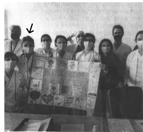
Il grazie dei medici per il sostegno ricevuto

-Τα τμήματα του Νοσοκομείου του Santorso, ενός εκ των πολλών του Νομού Veneto, που ασχολούνται με την αποκλειστική φροντίδα των νοσούντων από τον ιό Covid 19, είναι ακόμα γεμάτα, κυρίως με τρόφιμους γηροκομείων. Και όπως είπε η ως άνω Διευθύντρια «πρέπει μόνο να ελπίσουμε ότι το άνοιγμα δεν θα φέρει αρρώστους νέων ηλικιών».