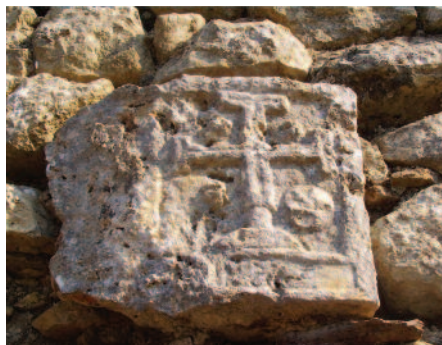
Η πέτρα με τον εγχάρακτο σταυρό που κλάπηκε