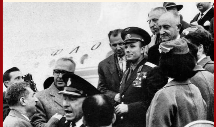
Η άφιξη του στο αεροδρόμιο του Ελληνικού

Ο Γκαγκάριν πέρασε στην Ιστορία ως ο πρώτος άνθρωπος που αντίκρισε τη Γη από ψηλά και έγινε ένα αιώνιο σύμβολο.