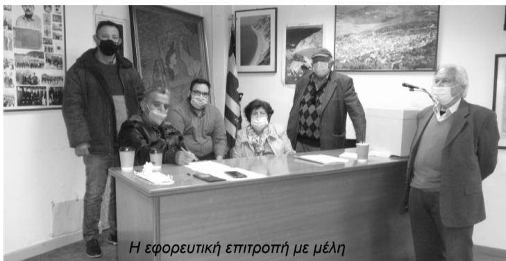
Η εφορευτική επιτροπή με μέλη