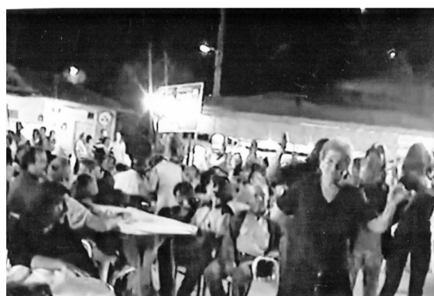
Άποψη από το πανηγύρι