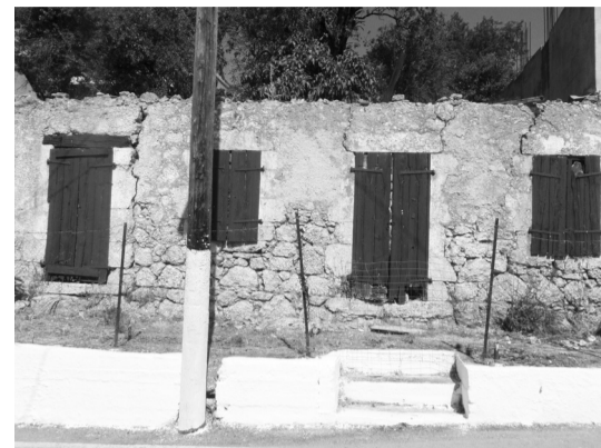
Το παλιό κτήριο

Εδώ και 54 χρόνια εξυπηρετεί το χωριό, τα γύρω χωριά, Έλληνες και ξένους που επισκέπτονται την Νότια Λευκάδα και ευχόμαστε να τα χιλιάσει. Αυτή είναι η ιστορία των φούρνων του χωριού μας, για να θυμούνται οι παλαιοί και να μαθαίνουν οι νέοι.