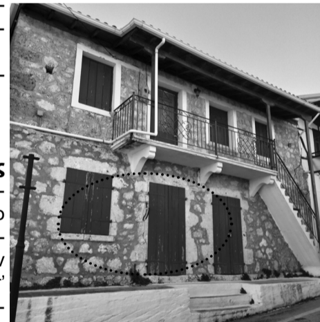
Εδώ μέσα ήταν ο νέος φούρνος