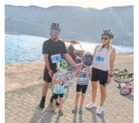
Το ζεύγος Βασιλάτου με τα κορίτσια τους που βραβεύτηκαν στο ποδήλατο