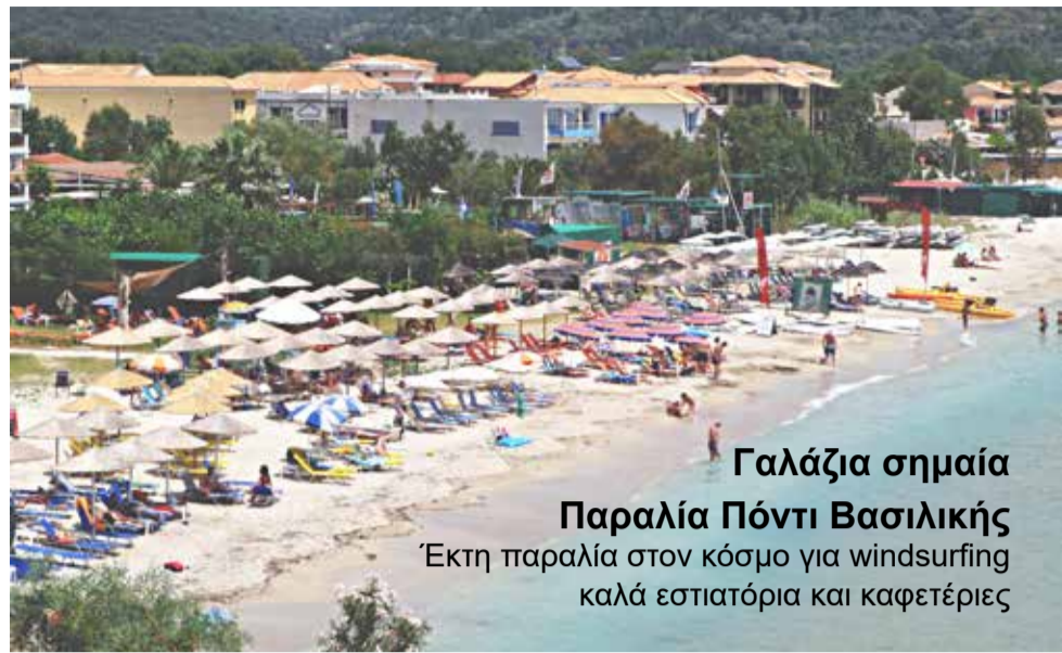
Γαλάζια σημαία Παραλία Πόντι Βασιλικής Έκτη παραλία στον κόσμο για windsurfing καλά εστιατόρια και καφετέριες