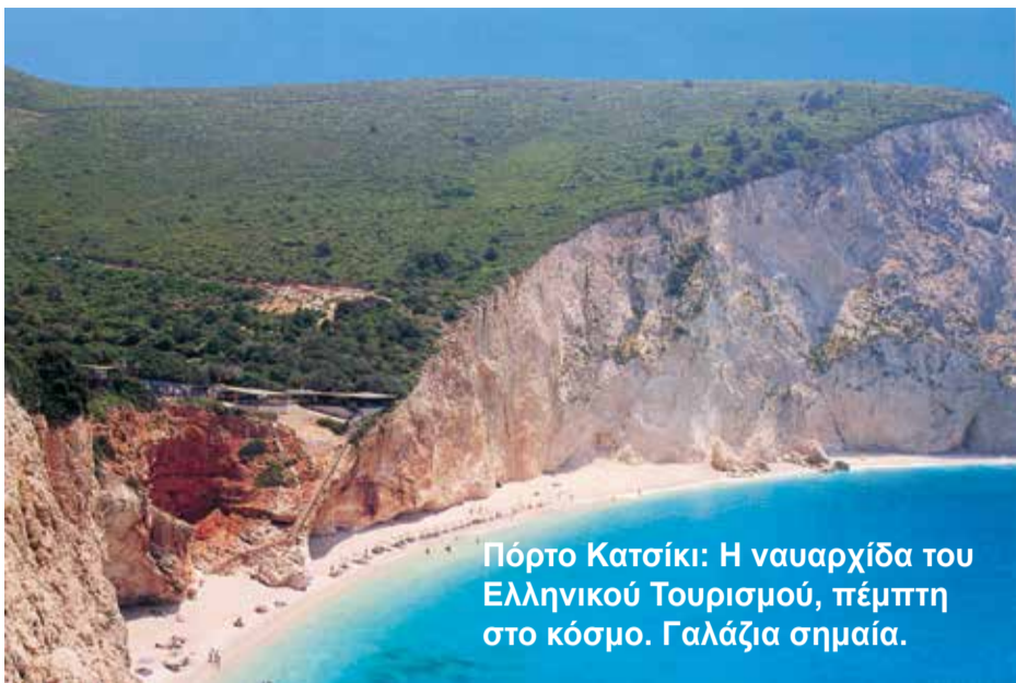
Πόρτο Κατσίκι: Η ναυαρχίδα του Ελληνικού Τουρισμού, πέμπτη στο κόσμο. Γαλάζια σημαία.