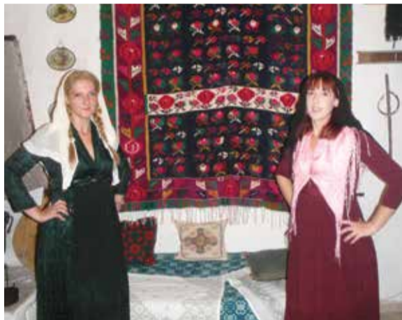
Το Μουσείο Λαϊκής Τέχνης «Ευάγγελος Βλασσόπουλος»

Συνεχίζεται το τρίπτυχο επισκεψιμότητας στον Άγιο Πέτρο, το οποίο είχε πέρυσι το καλοκαίρι μεγάλη επιτυχία. Δηλ. το Μουσείο Λαϊκής Τέχνης «Ευάγγελος Βλασσόπουλος», το ζωκλήσι των Αγίων Αποστόλων με τα αιωνόβια κυπαρίσσια και η «Φραγκοκλησιά» - τα ερείπια της μοναδικής καθολικής εκκλησίας στη Λευκάδα.