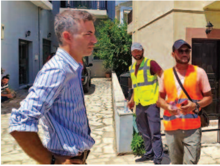
Συνέχεια από τη σελ. 1

μητά αποτελέσματα, με συνέπεια ν' αναπτύσσονται μεγάλες ταχύτητες, να πραγματοποιούνται προσπεράσεις και πολλές φορές να γίνονται σοβαρά τροχαία ατυχήματα. Το συγκεκριμένο τμήμα του Επαρχιακού δικτύου, έχει απασχολήσει σοβαρά τόσο την Π.Ε. Λευκάδας όσο και την Τροχαία, αφού αυξάνονται τα τροχαία συμβάντα τα τελευταία έτη. Άλλωστε, αποτελεί και διαρκή αγωνία των κατοίκων της Νικιάνας, που μου εκφράστηκε σε κάθε επίσκεψή μου στην περιοχή. Αποφασίσαμε λοιπόν, να χρηματοδοτήσουμε από το αποθεματικό μας τη μελέτη, ώστε η κατασκευή